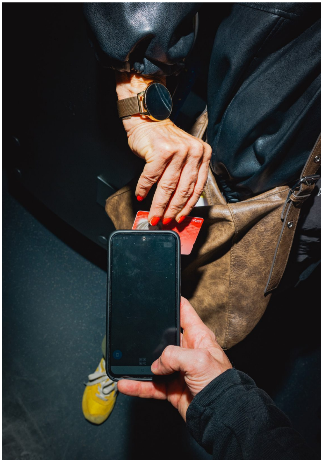
Ticketkontrolle: Die SBB registrieren immer mehr Menschen als Sünder und Mehrfachtäter.

Zudem könnten die wenigsten komplett auf die Nutzung des ÖV verzichten, sagt der Schuldenberater. Sie werden so immer wieder bei Fahrausweiskontrollen geschnappt. «Leider», so Bertsch, «häufen sich in den letzten Jahren die Fälle, in denen Leute dadurch in eine katastrophale Schuldenspirale gerieten.» Laut SBB-Erhebungen stiegen die Einträge im nationalen Register der Ticketsünder denn